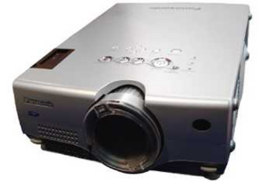
■ パナソニック プロジェクタ