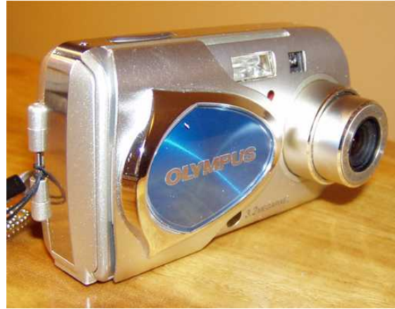
■ オリンパス デジカメ