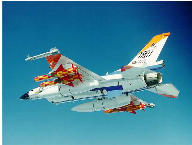
■ 実時間Linux 航空自衛隊で計測に使用