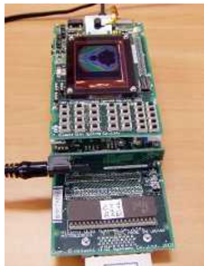
ルネサス V850 SH-Mobile/SH-2A