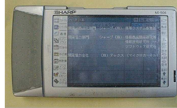
■ シャープ ザウルス