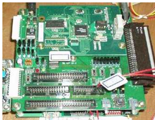
セイコーエプソン C33