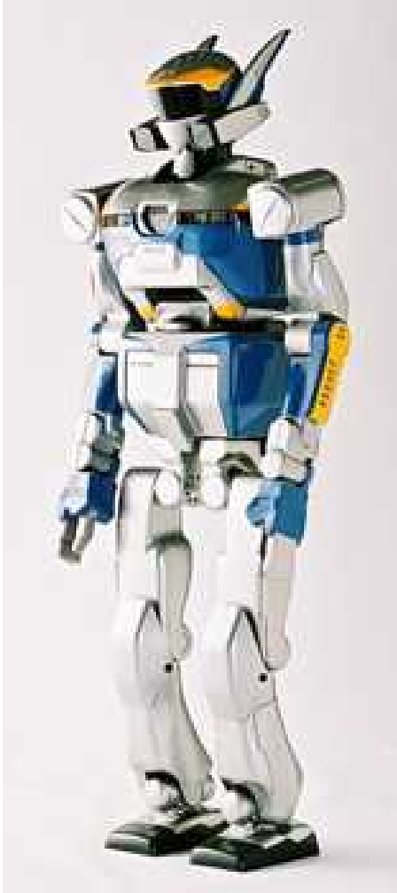
■(独)産業技術総合研究所 知能システム研究部門 ヒューマノイド研究グループとの 実時間Linux共同開発